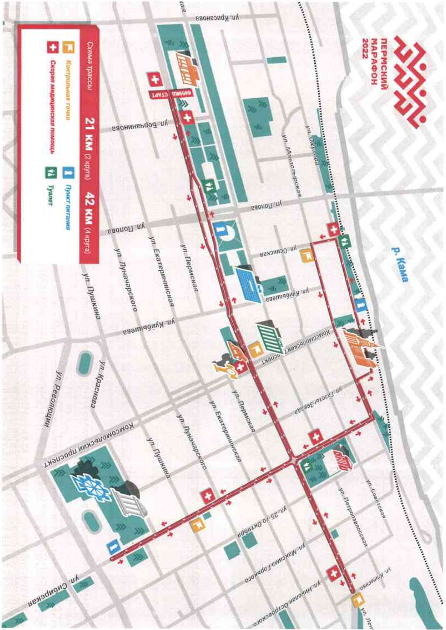
Схема трассы: 21 км (2 круга) 42 км (4 круга)