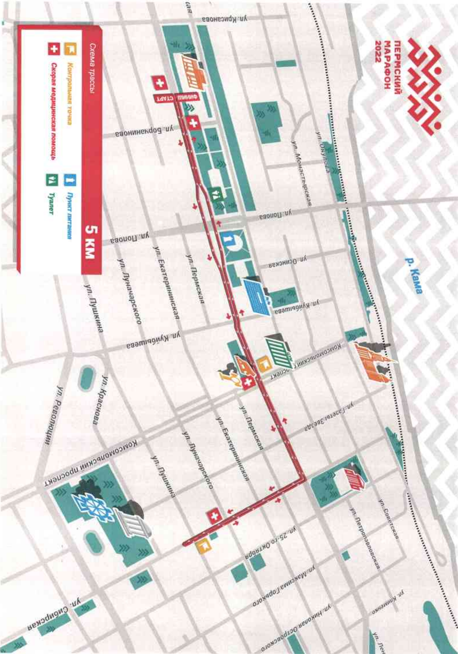
Схема трассы: 5 KM